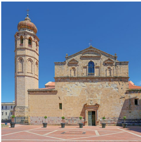
La Cattedrale di Santa Maria Assunta è il duomo di Oristano e la chiesa madre dell'arcidiocesi Arborense