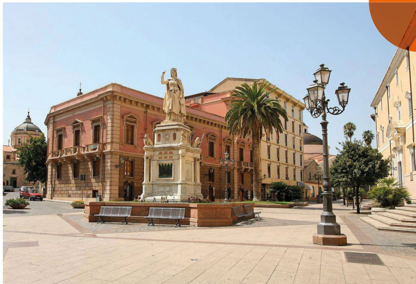
Piazza Eleonora d'Arborea, la piazza più rappresentativa della città con l'impronta classicista conferitale nell'Ottocento