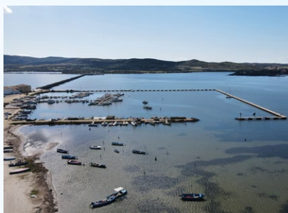
Marceddi e la Peschiera Corru S'Ittiri