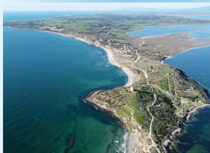
San Giovanni di Sinis