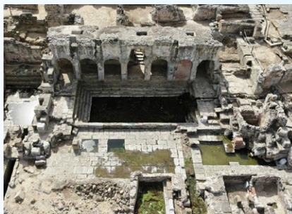
Terme di Fordongianus