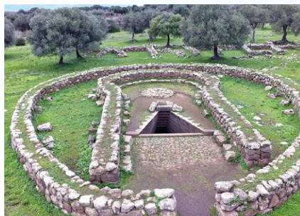
Pozzo Sacro di Santa Cristina - Paulilatino