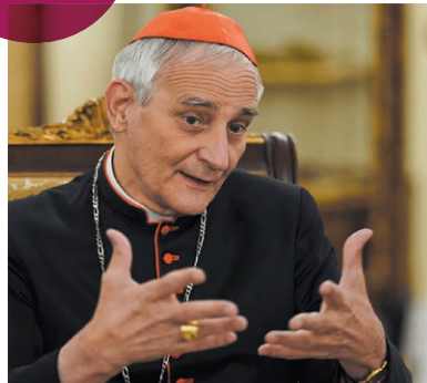
Cardinale Matteo Maria Zuppi, Arcivescovo metropolitano di Bologna, Presidente della Conferenza Episcopale Italiana