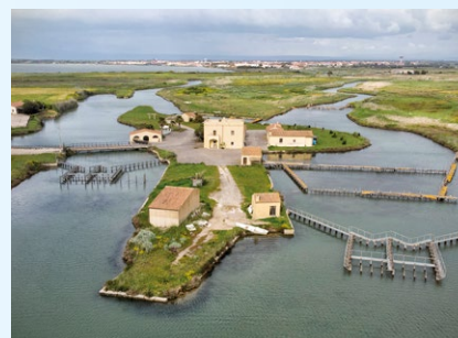
Peschiera di Mar'e Pontis - Cabras