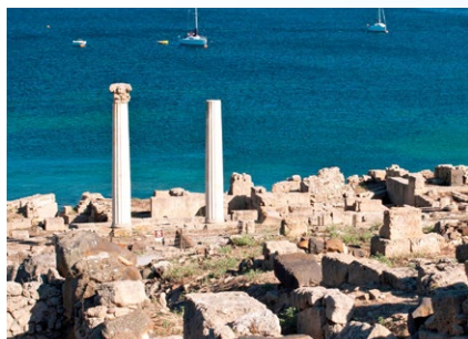
Area Archeologica di Tharros

27, 28 e 29 giugno dalle 9,30 alle 14,00