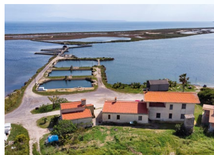
Peschiera di Mistras - Cabras