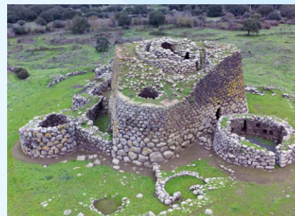
Nuraghe Losa - Abbasanta